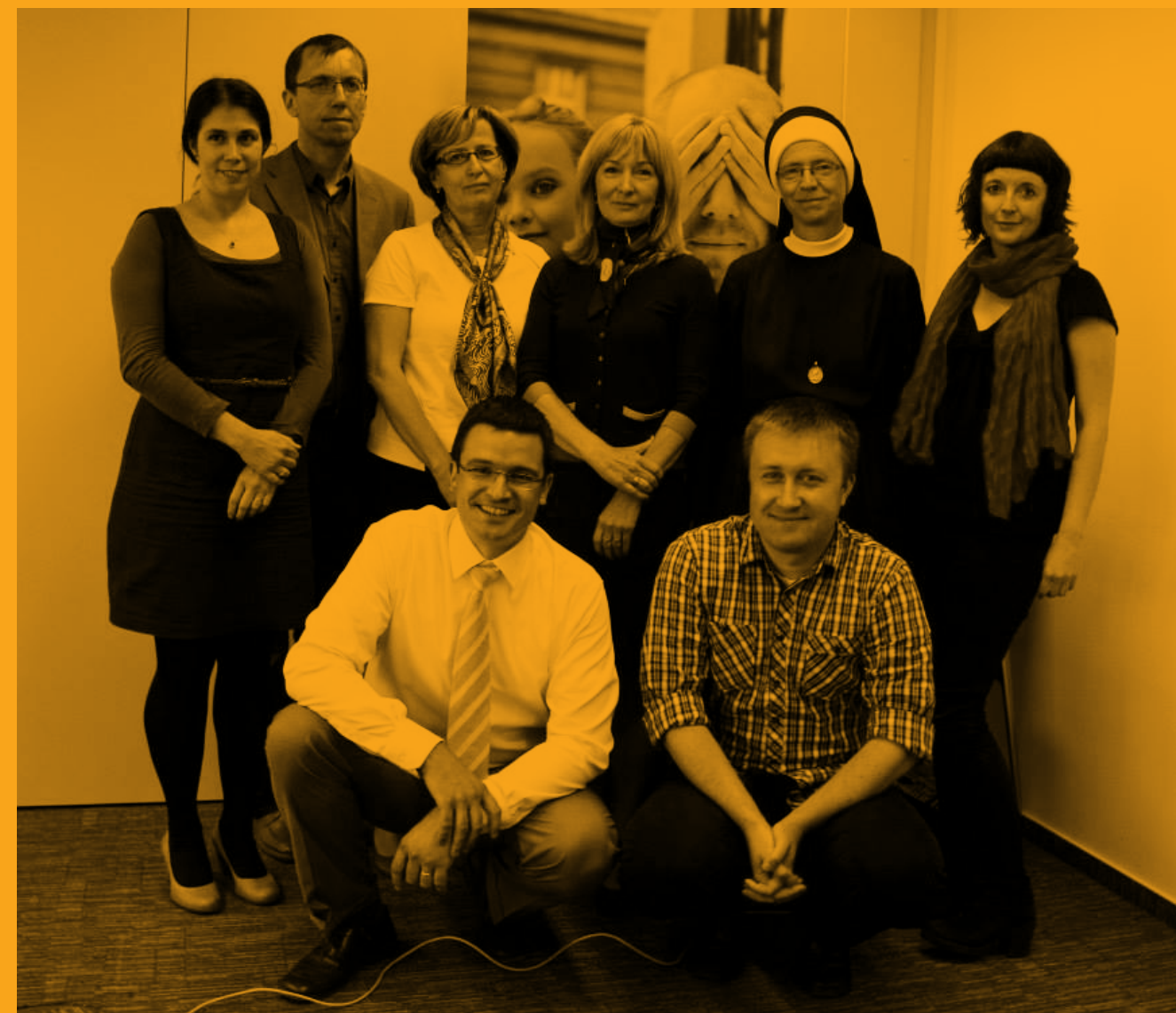
Správní rada NF AVAST a odborní hodnotitelé v programu

ODDICUS: Je péče poskytovaná pacientům v závěru jejich života v souladu s jejich přáními a hodnotami? Prospektivní observační projekt u pacientů zemřelých v terciárním zdravotnickém zařízení. Výzkumný projekt realizovaný s podporou velké nemocnice. Díky němu bude možné získat zajímavé zpětné vazby a podněty pro zlepšení paliativní péče v nemocnicích a dalších zdravotnických zařízeních.