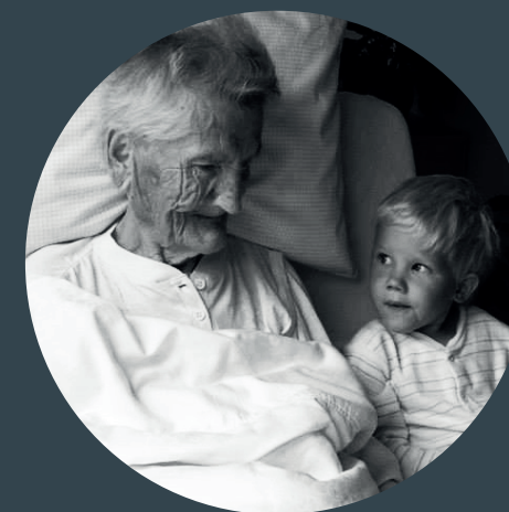
SPOLU AŽ DO KONCE Pilotní program zaměřený na podporu péče o umírající v ČR