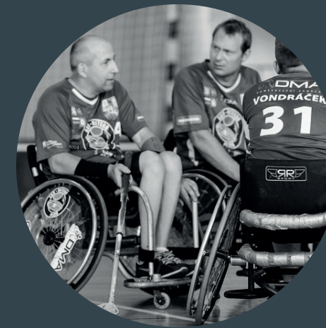
FOND SPRÁVNÍ RADY