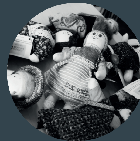
FOND ZAMĚSTNANCŮ AVASTU